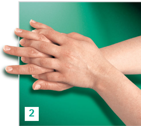
Rechte Handfläche über linkem Handrücken und linke Handfläche über rechtem Handrücken.