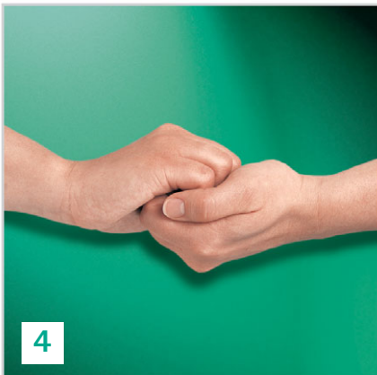
Außenseite der Finger auf gegenüberliegende Handflächen mit verschränkten Fingern.