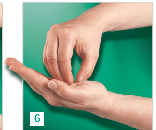
Kreisendes Reiben hin und her mit geschlossenen Fingerkuppen der rechten Hand in der linken Handfläche und umgekehrt.

Desinfektionsmittel in die hohlen, trockenen Hände geben. Nach dem oben auf geführten Verfahren das Produkt in die Hände bis zu den Handgelenken kräftig einreiben. Empfohlene Einwirkzeit des jeweiligen Produktes beachten.