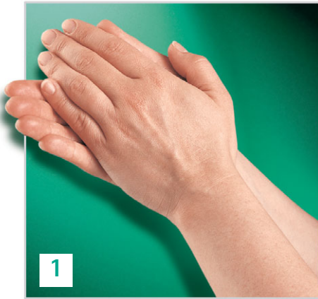
Handfläche auf Handfläche.

Standard-Einreibmethode für die hygienische Händedesinfektion gem. EN 1500